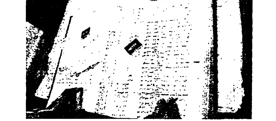
معاملات اخراج قيد امام مامور نفوس مرجعيون

صيدا - من مراسل «الانوار»: باشرت دائرة نفوس مرجعيون العمل في مقرها الجديد بسراي صيدا، بعد تفصيل المسجلات المأتمنة للدائرة من سراي مرجعيون الى سراي صيدا عبر طريق حاصبيا - شحوره.